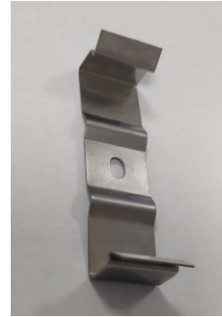
blaszki montażowe (2x)